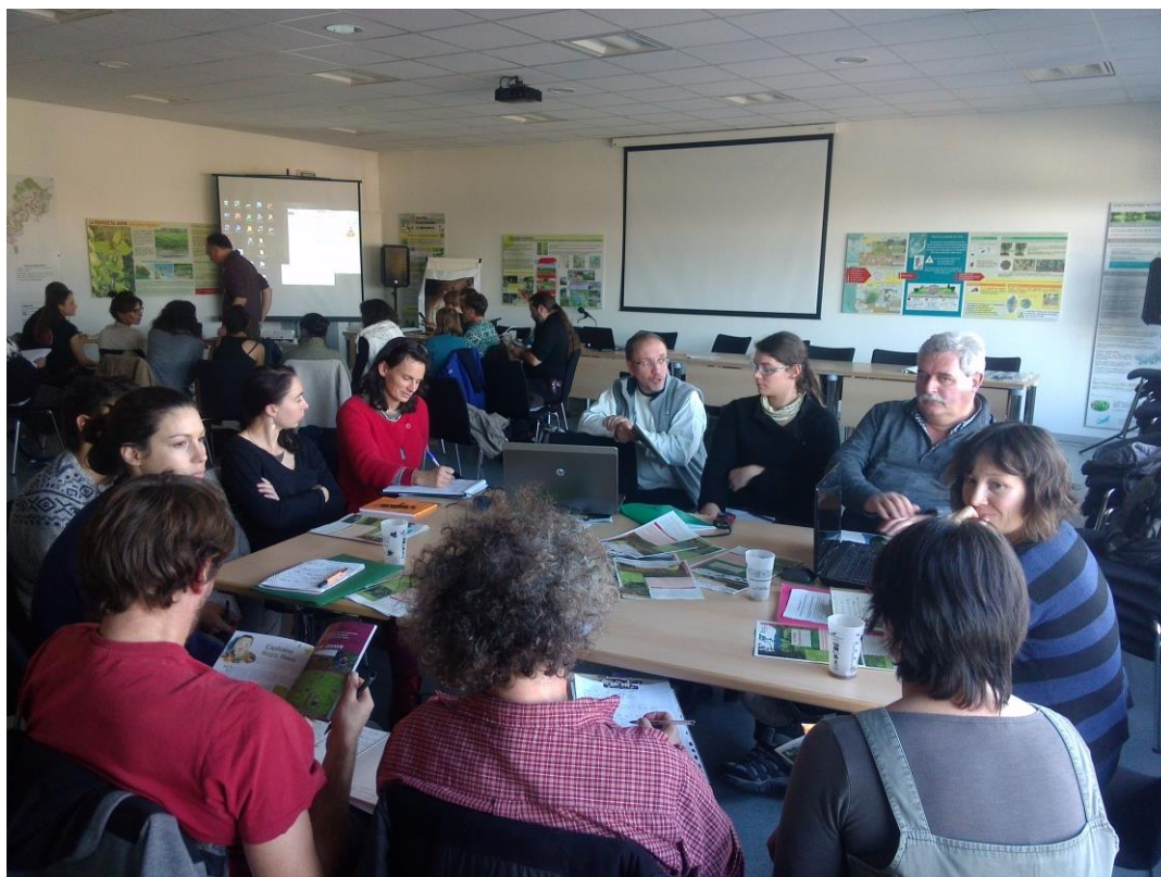
Temps d'ateliers 2